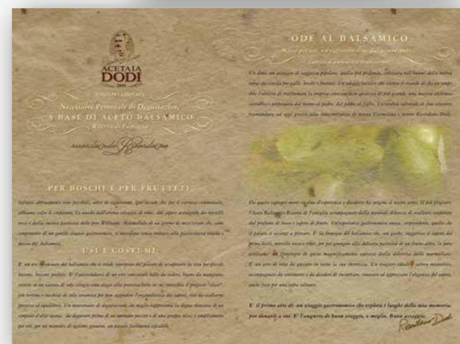
Monografia di Trismoka e serving suggestion di Acetaia Dodi