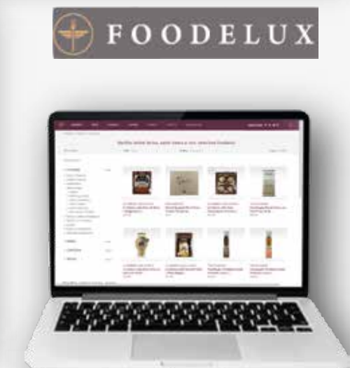
Tono di voce sito personale e di Olitalia, brand naming e contenuti digital di Foodelux